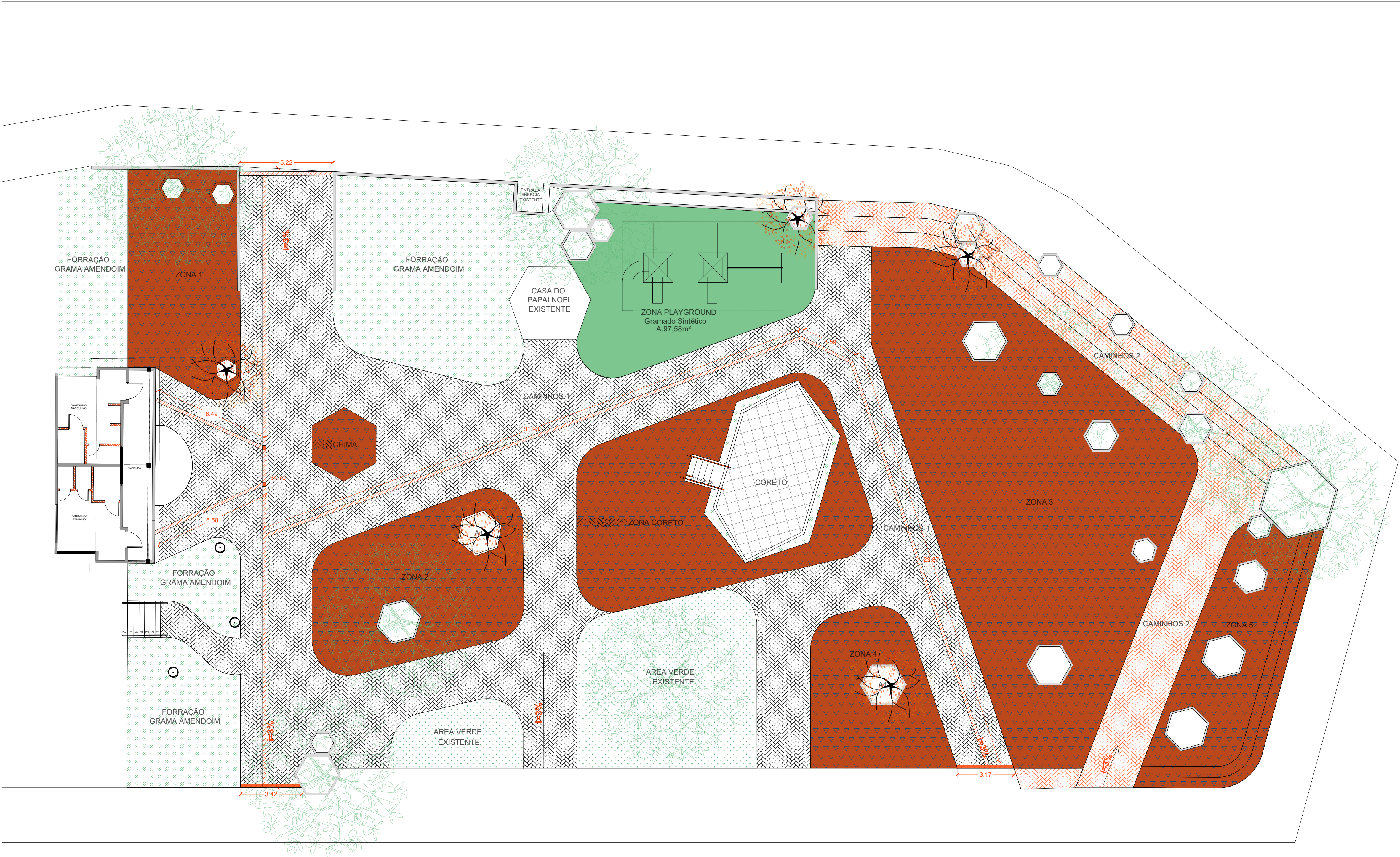
PLANTA BAIXA ACESSIBILIDADE E PAVIMENTAÇÃO ESC.: 1/100