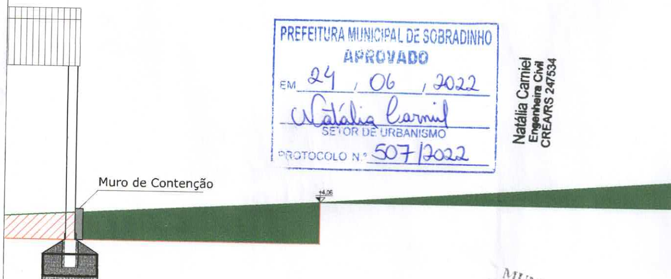
CORTE AA Esc.: 1/100

MUNICÍPIO DE SOBRADINHO - RS SERVIÇOS URBANOS