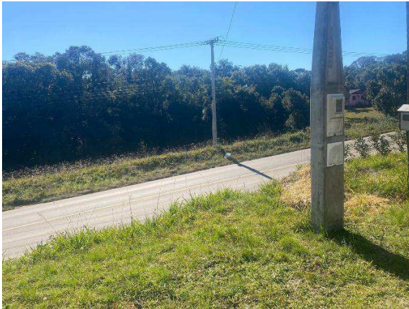
Figura 5: Vista do local a ser perfurado.